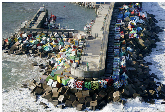
Puerto de Llanes (Asturias)

Cada una de las tres salas del Museo Nacional de Artes Decorativas recogerá una personal interpretación de ambas obras, moda y escultura, dirigida por el creador Miguel Marinero y realizada por los alumnos de Bellas Artes de la Universidad Complutense de Madrid.