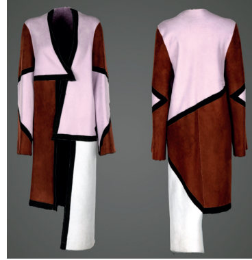
Abrigo de piel de cordero merino, anteado y reversible.

Una primera sala muestra lo que siente, paladea, asimila y rescata de su memoria el artista. Todo aquello que le inspira y le transmite, que le empuja a crear para diseñar y dar forma sus piezas. El artista es cómplice de su público, pero también de la naturaleza. El agua, la tierra, el aire y los colores primarios que guarda en su retina.