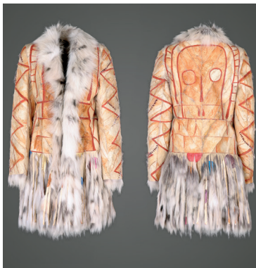
Representación del Ídolo de Peña Tú, 2000 a.C., abrigo de zorro patchwork pintado a mano.