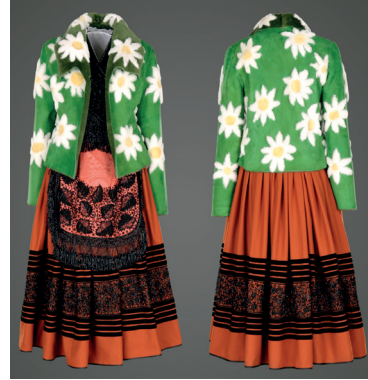
Paisaje en primavera de Llanes. Chaqueta de cordero merino. Traje de aldeana, bordado a mano.

La última sala descubre la influencia del lugar en el color y los motivos. La interpretación de una escollera bañada por el Cantábrico, que amanece cada día a los pies de un pueblo marinero. La historia de un pueblo desde su herencia, que permanece en una vidriera, utensilios tradicionales, instrumentos, bordados llaniscos de azabache, y que perduran en la mano del artesano.